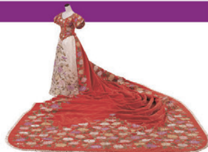
大礼服 明治20年代末 昭憲皇太后着用