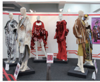
▲文化ファッション大学院大学