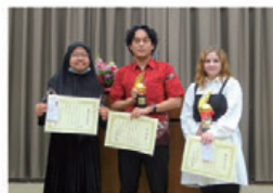
▲日本語スピーチ大会