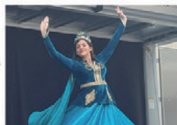
▲国際文化フェスティバル