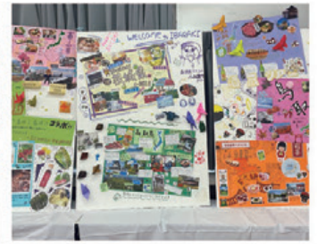
▲文化外国語専門学校