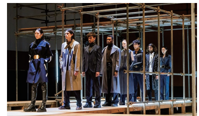
ファッションショー

作品審査により選抜されたファッションクリエイション専攻（ファッションデザインコース、ファッションテクノロジーコース）院生 14 名による修了作品、計 88 体をコレクション形式で披露いたします。ランウェイとなる舞台は、今回の撮影のためにオリジナルで設営。作品の個性と共に迫力のある映像が完成いたしました。