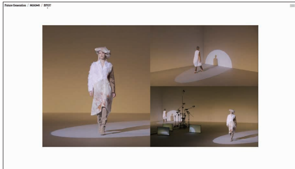
ファッションショー