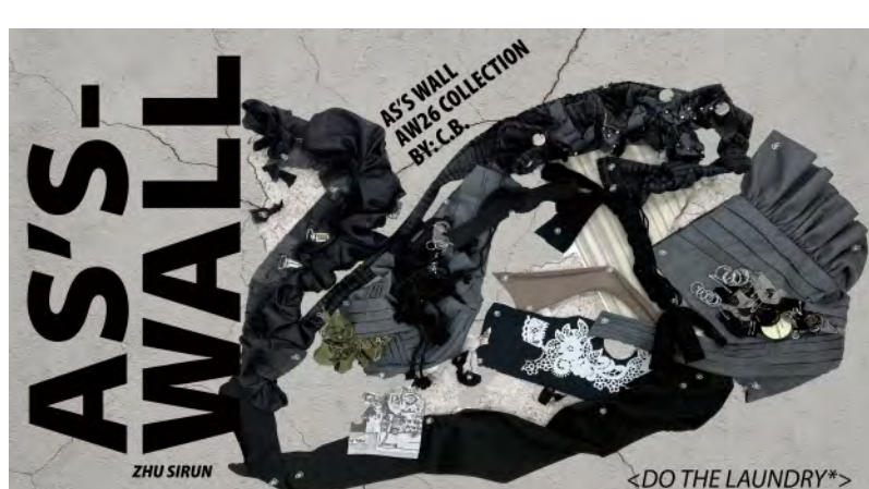
10. シュ シジュン / ZHU SIRUN 「AS'S WALL」