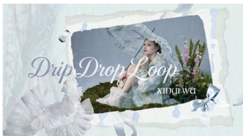
6. ゴ キンイ / WU XINYI 「Drip Drop Loop」