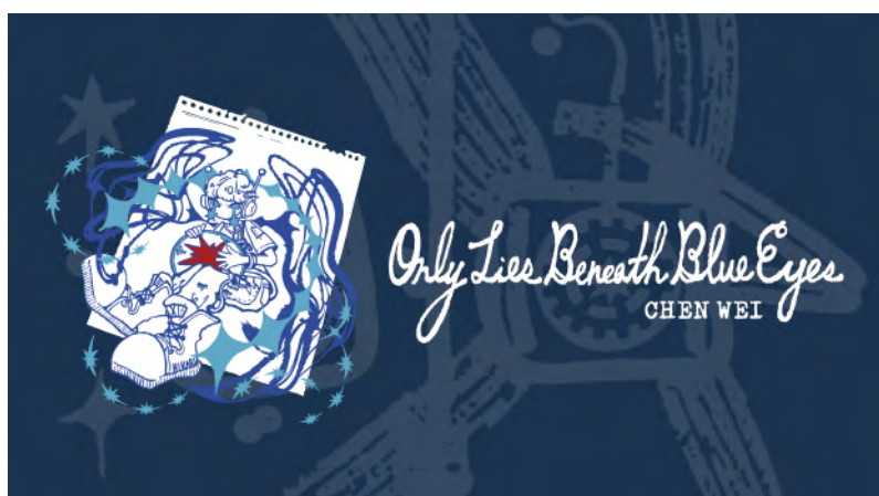
7. チェン イ / CHEN WEI 「Only Lies Beneath Blue Eyes」