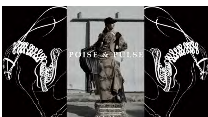
8. ゴ ギ / WU YI 「Poise & Pulse」