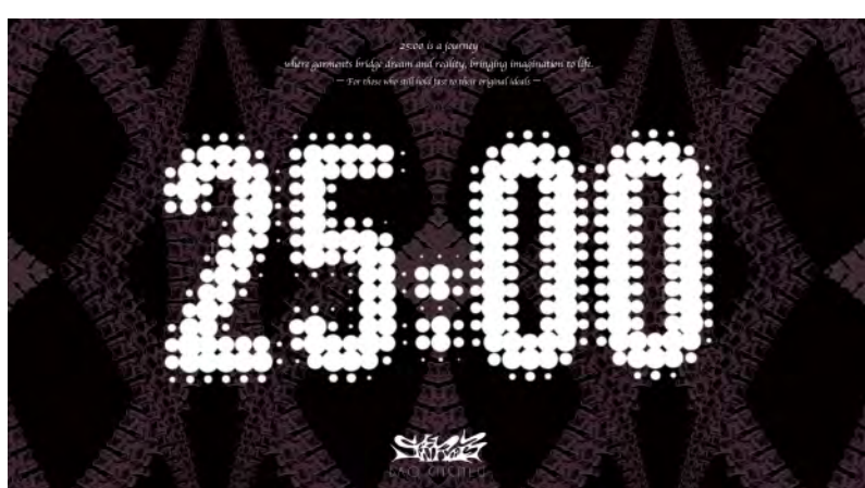
4. ホウ シンロ / BAO CHENLU 「25:00」