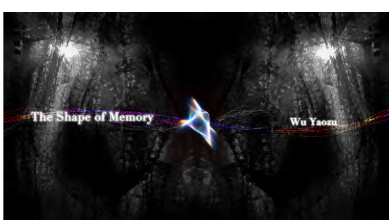
11. ゴ ヨウソ / WU YAOZU 「The Shape of Memory」