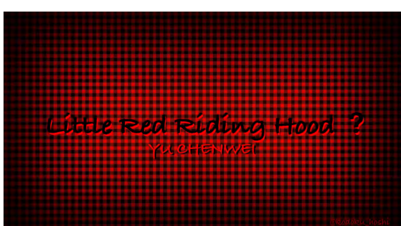
9. ヨ シンイ / YU CHENWEI 「Little Red Riding Hood ?」