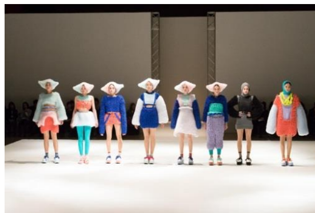
※画像は昨年のBFGU FWの一部です。